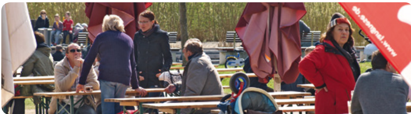
Lebensweltanalyse – die Gemeinde fragt nach den Bedürfnissen und Nöten ihres Stadtteils, ihres Dorfes